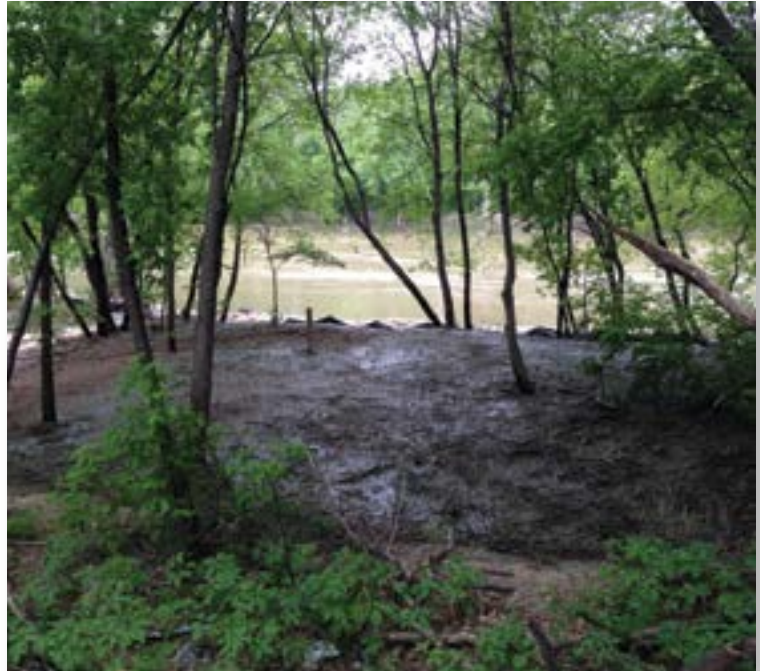
1 de junio de 2015 Assiniboine Shoreline después de la nivelación e instalación de la roca.