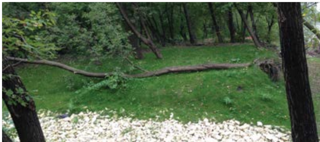
1 de agosto de 2015: Todos los objetivos de revegetación se cumplieron y se superaron.

Sólo dos meses después de la instalación, la mezcla de semillas nativas había vegetado con tanto éxito que el ingeniero, el Grupo KGS y los inspectores de la ciudad de Winnipeg declararon que estaban satisfechos con los resultados. El propietario estaba satisfecho con los resultados de estabilización y revegetación, y con el ahorro sustancial de costos en el proyecto.